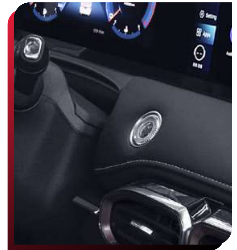
SMART KEY (BOTÓN DE ENCENDIDO)