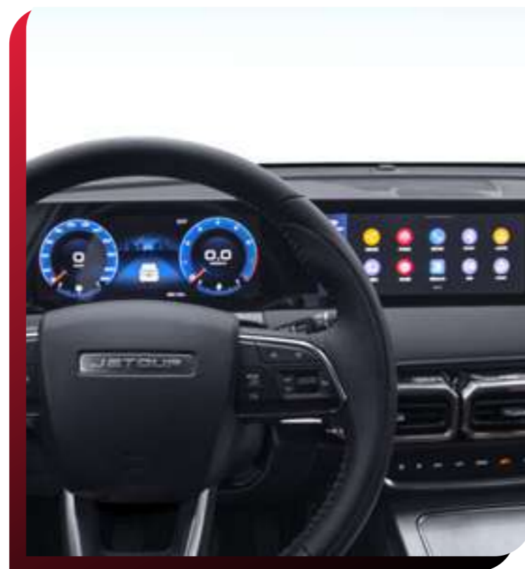
SISTEMA DE INFOENTRETENIMIENTO Y MIRROR LINK