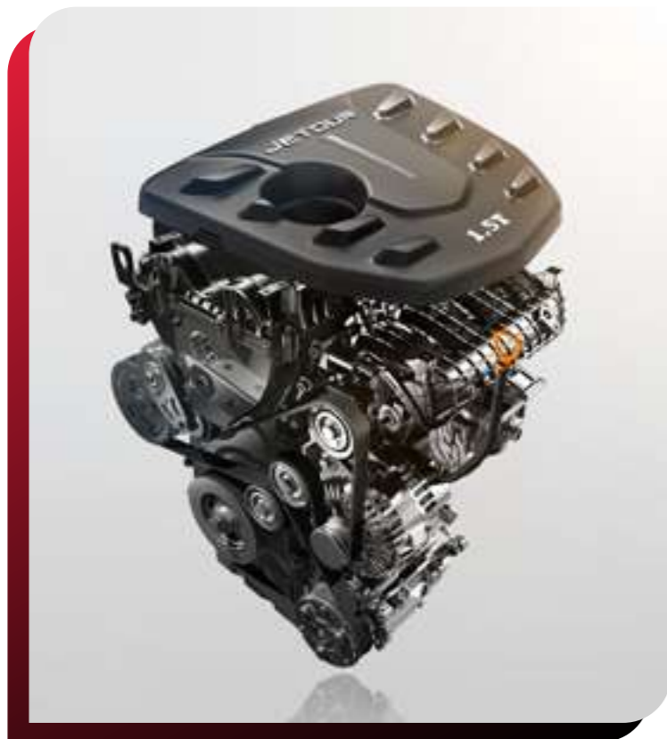
MOTOR 1.5 / 1.6 TURBO

Pon a prueba la resistencia de esta gran SUV