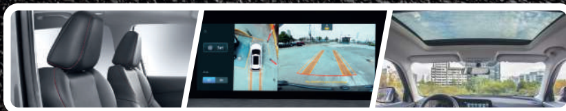
Asientos de eco cuero